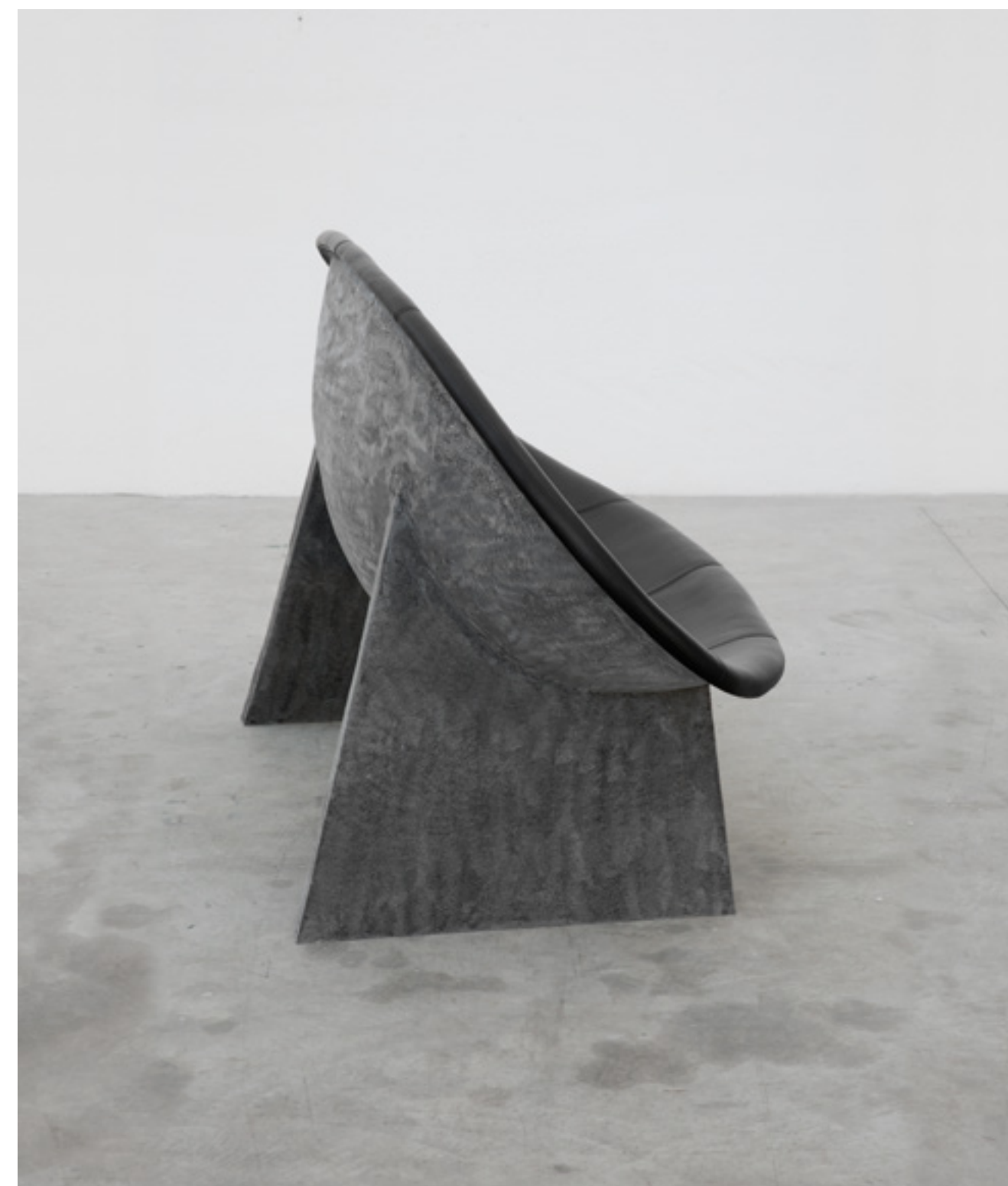
bruma design verter turrone, 2020

seduta con scocca in vetroresina rivestita in skai sofa in fibreglass upholstered in leatherette cm 190x83xh99