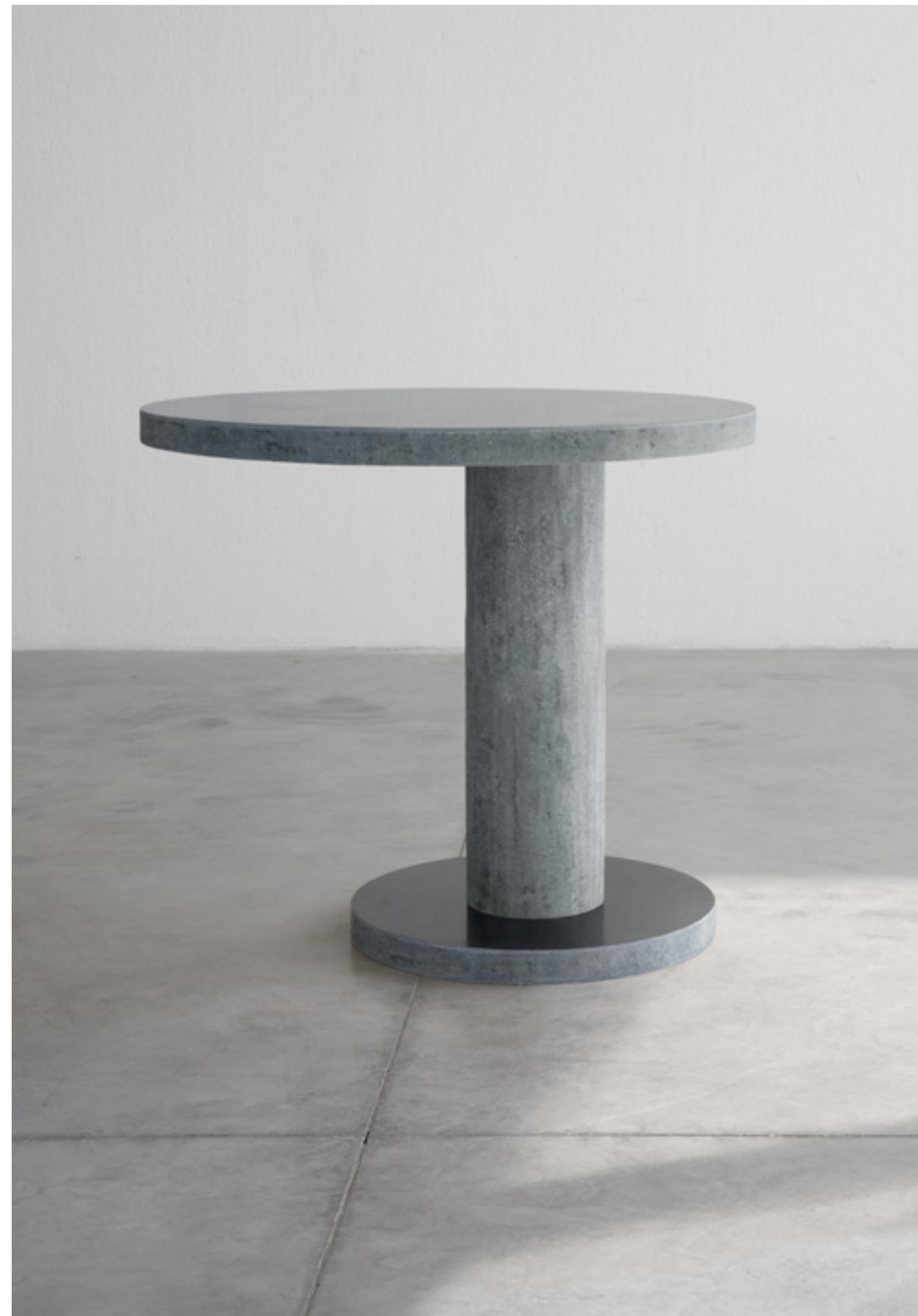
du.o design verter turrone, 2021

tavolo in vetroresina side table in fibreglass cm Ø90xh90