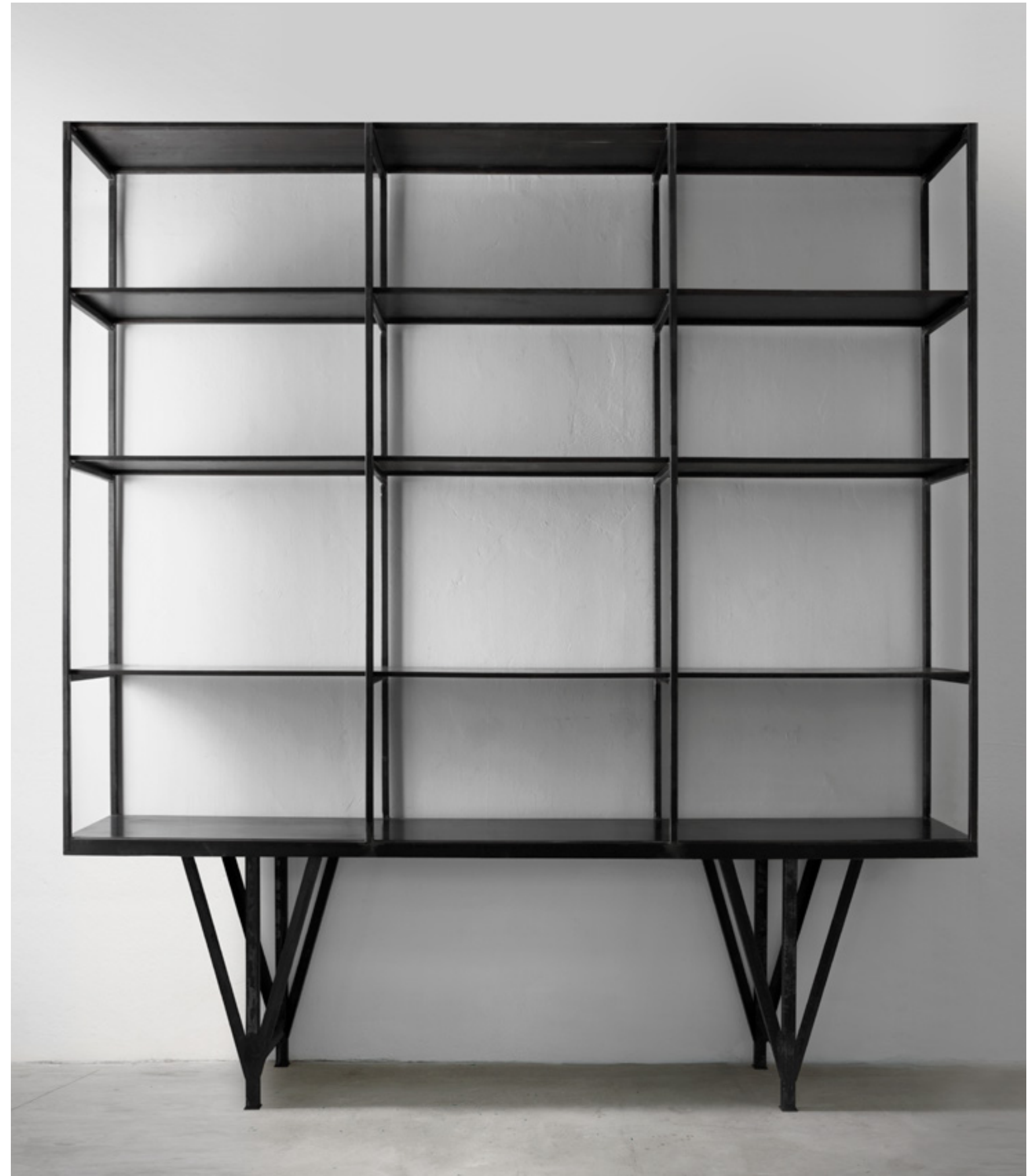
sólo design verter turroni, 2017

scaffale in metallo shelf in metal cm 300x51xh250