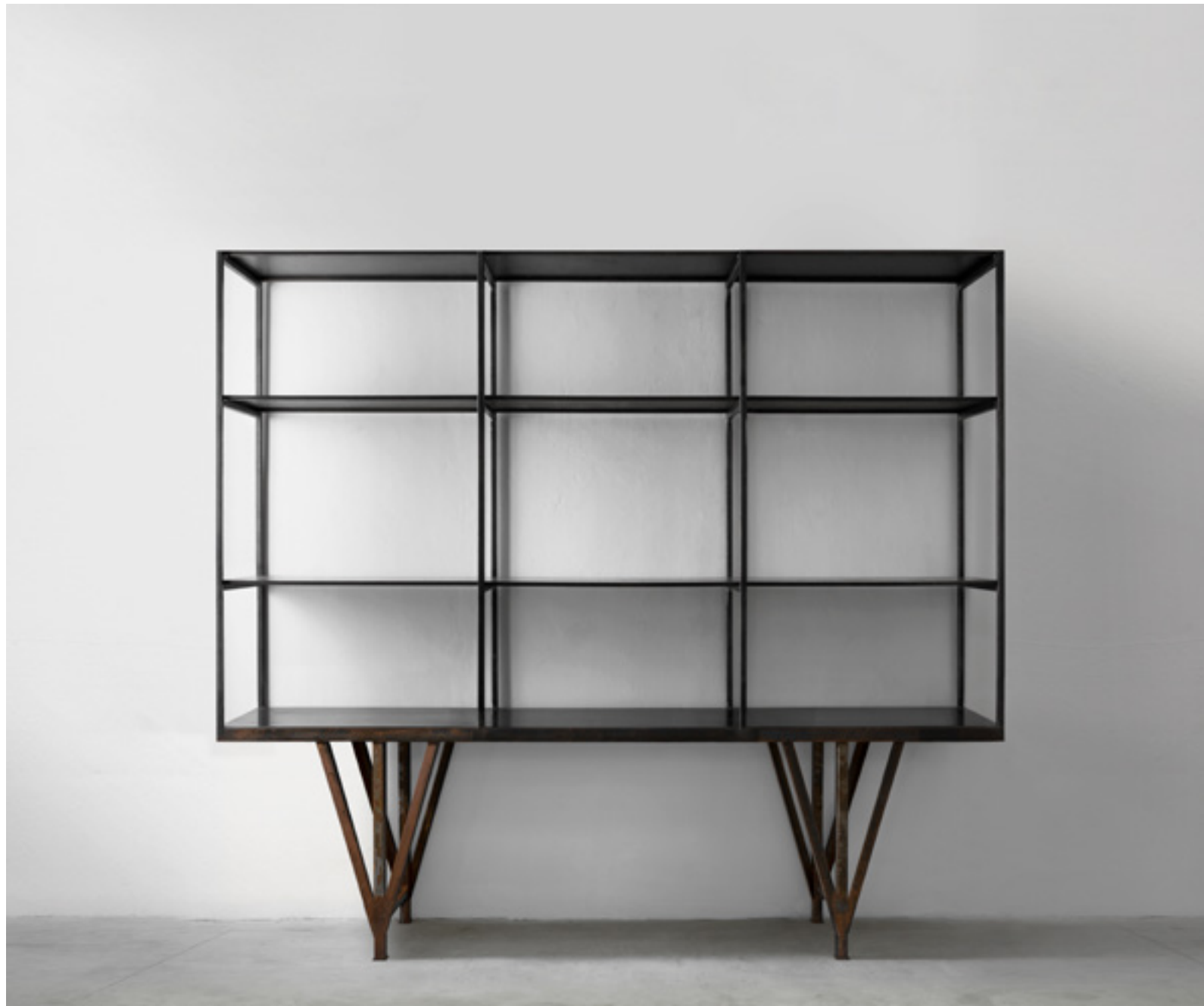
sólo design verter turroni, 2021

scaffale in metallo shelf in metal cm 300x51xh250