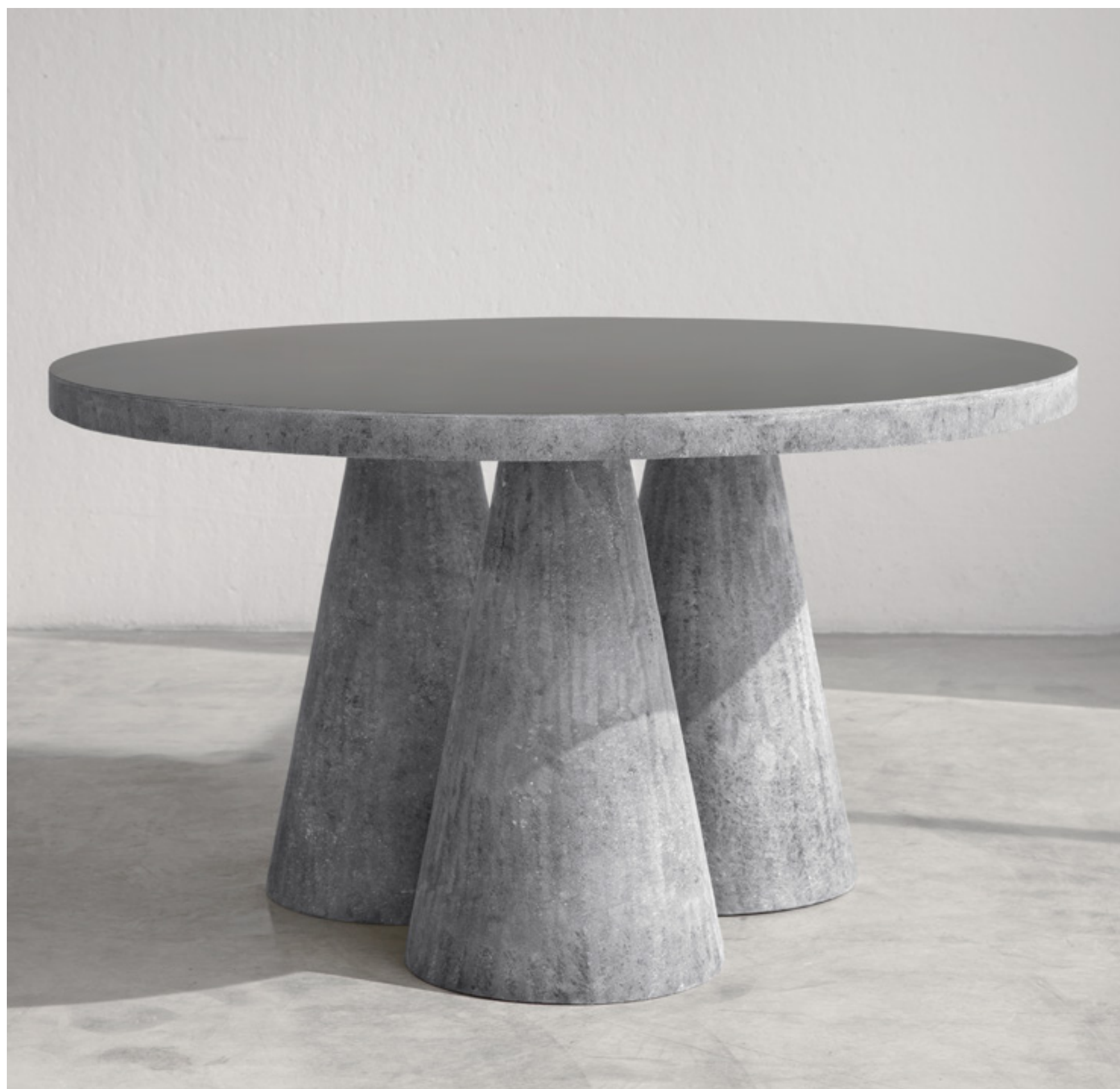
equilibrium design verter turrone, 2021 tavolo in vetroresina table in fibreglass cm Ø125xh74