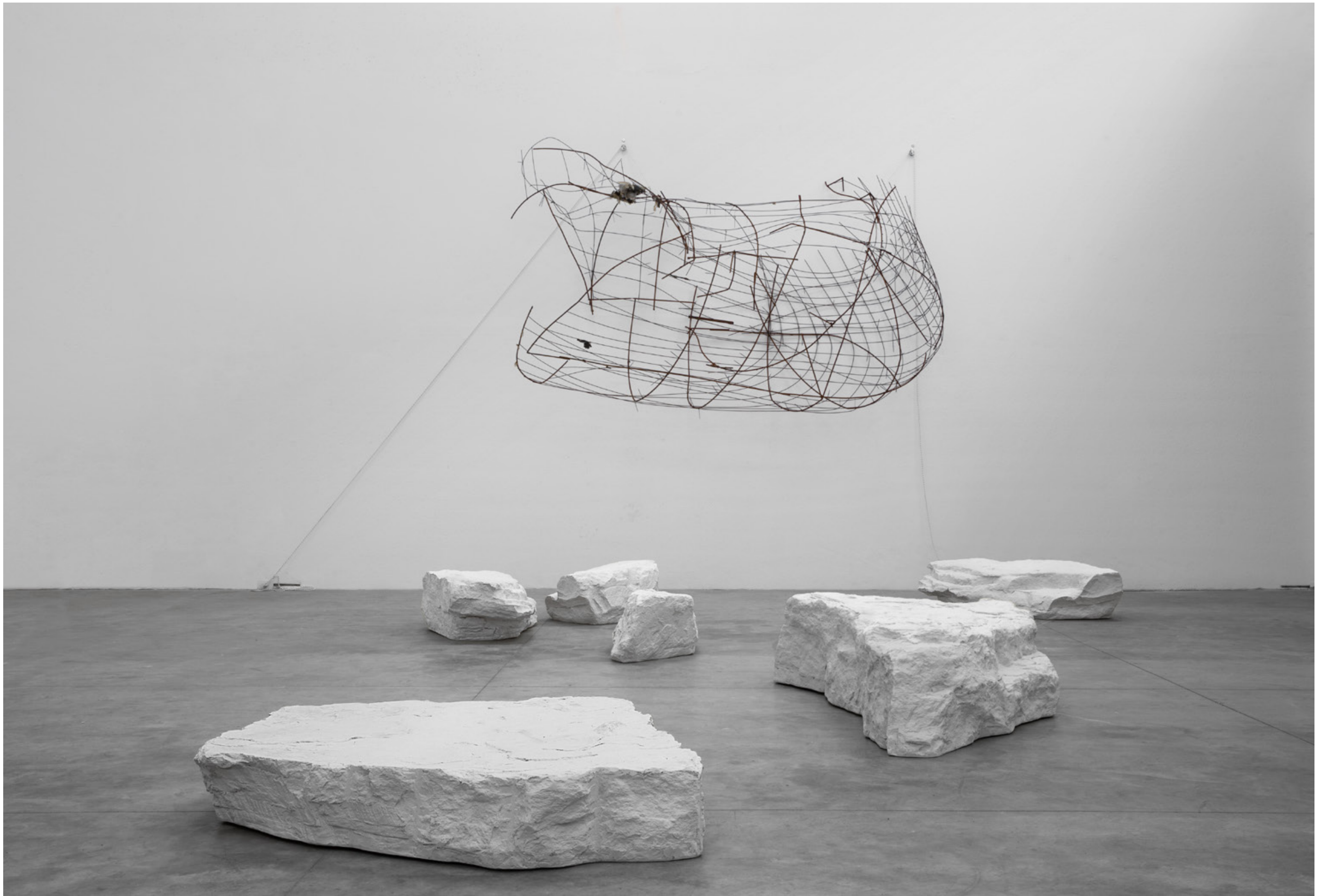
arenaria design verter turrioni, 2014/2021

seduta-tavolo/elemento scultoreo in vetroresina seat-coffee table/sculptural element in fibreglass