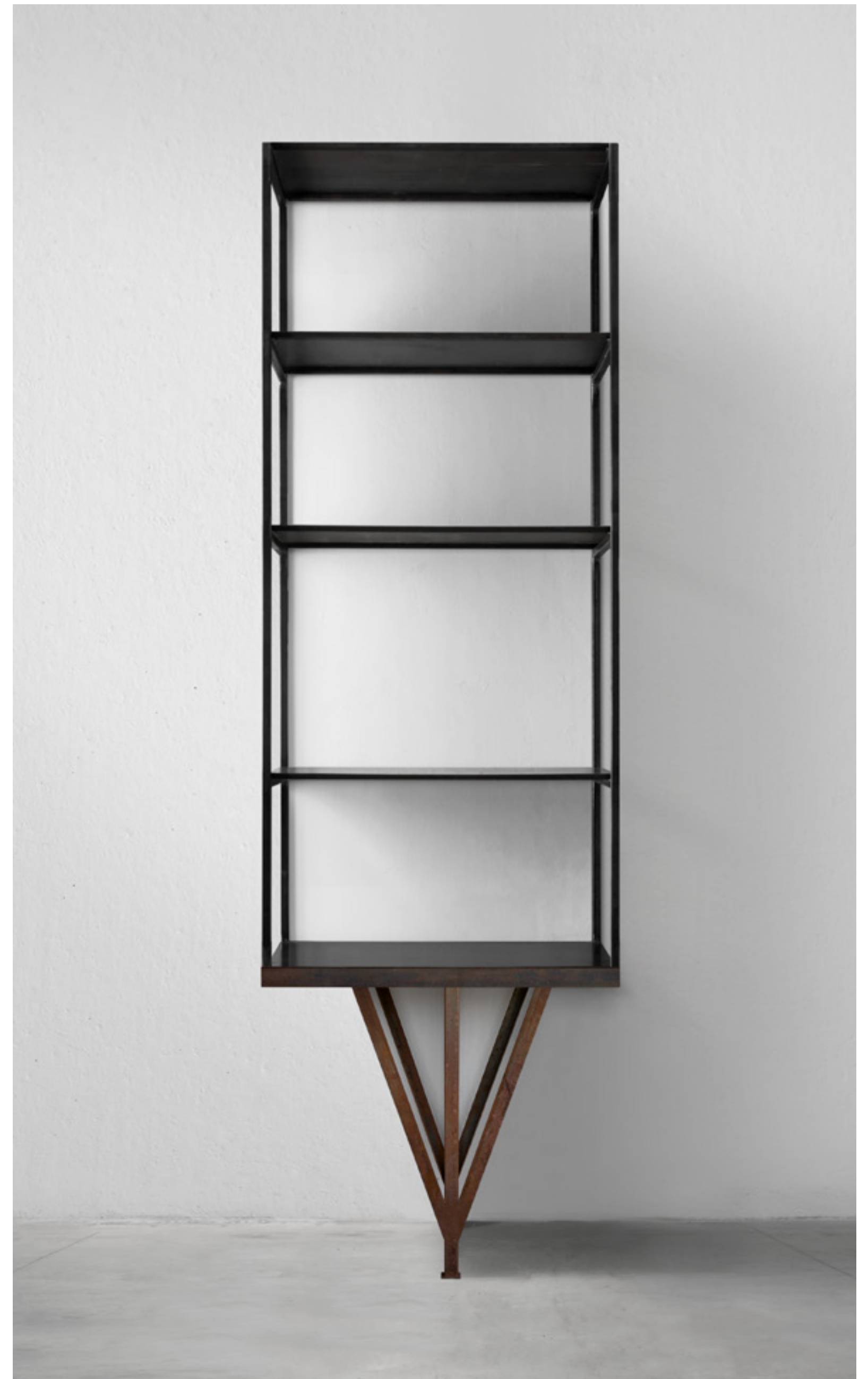
sólo design verter turróni, 2021 scaffale in metallo shelf in metal cm 100x51xh350