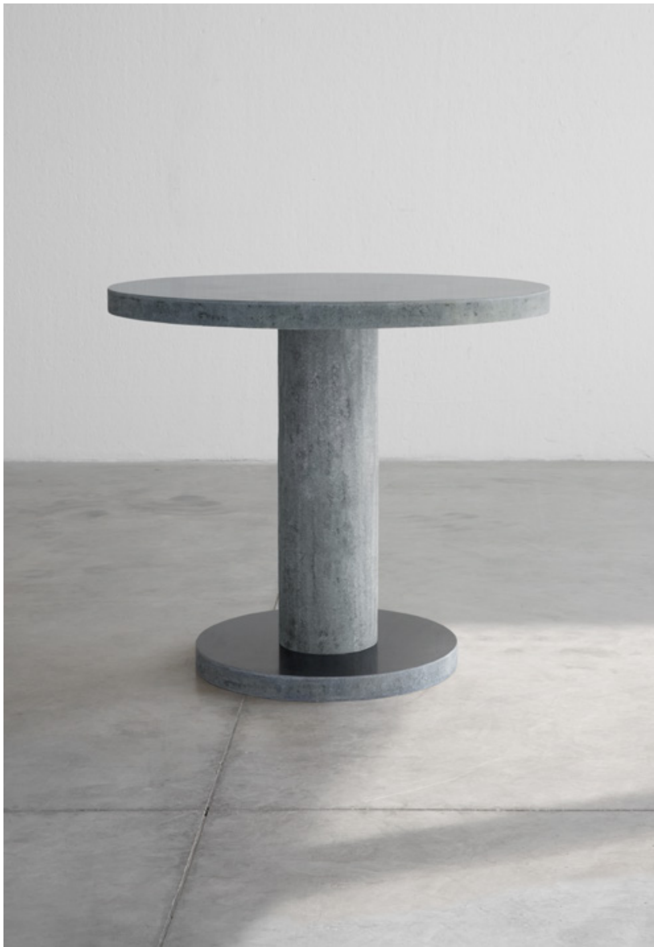
du.o design verter turrone, 2021

tavolo in vetroresina side table in fibreglass cm Ø90xh90