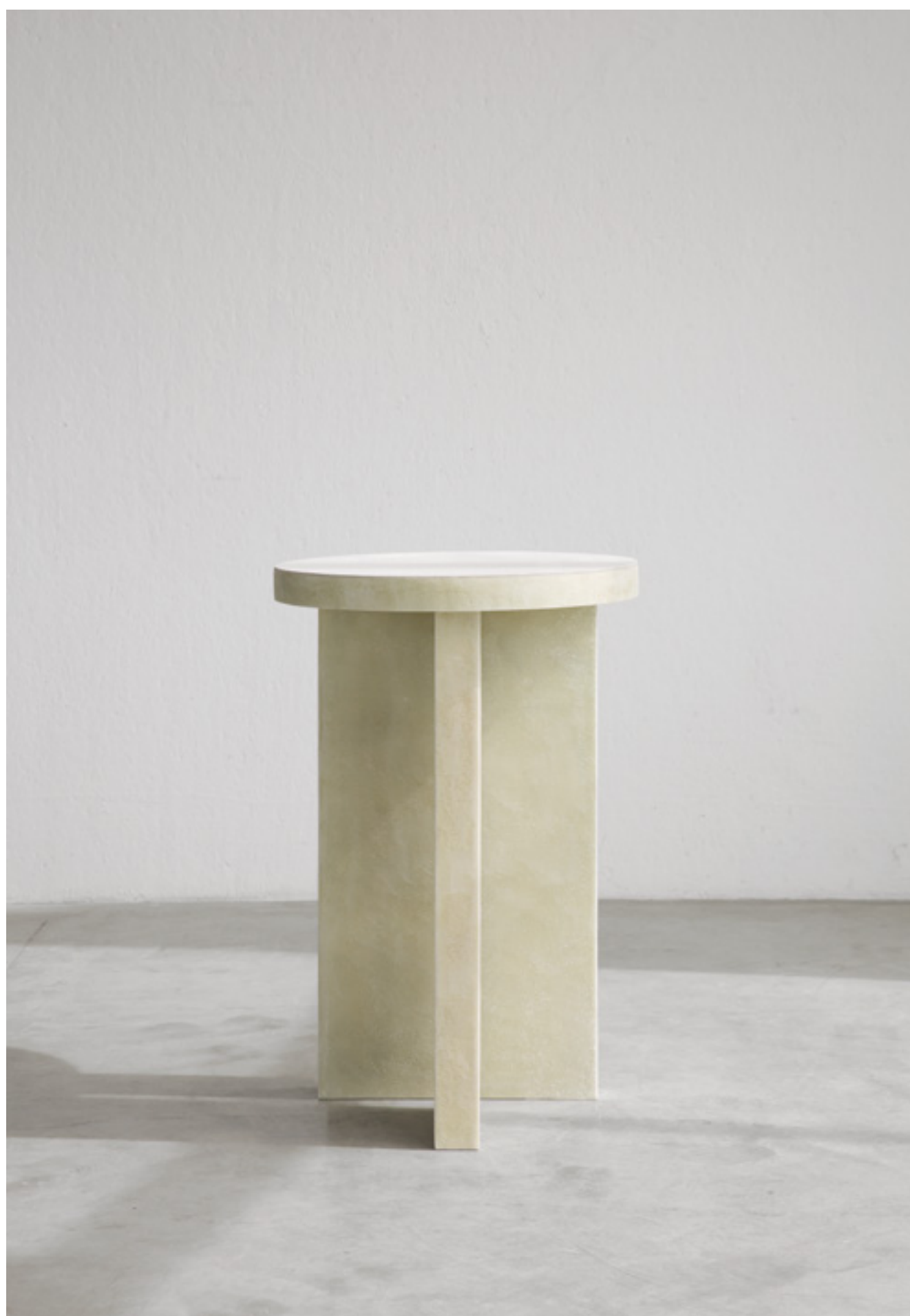
E42 design verter turróni, 2021 tavolo in vetroresina side table in fibreglass cm Ø56xh86