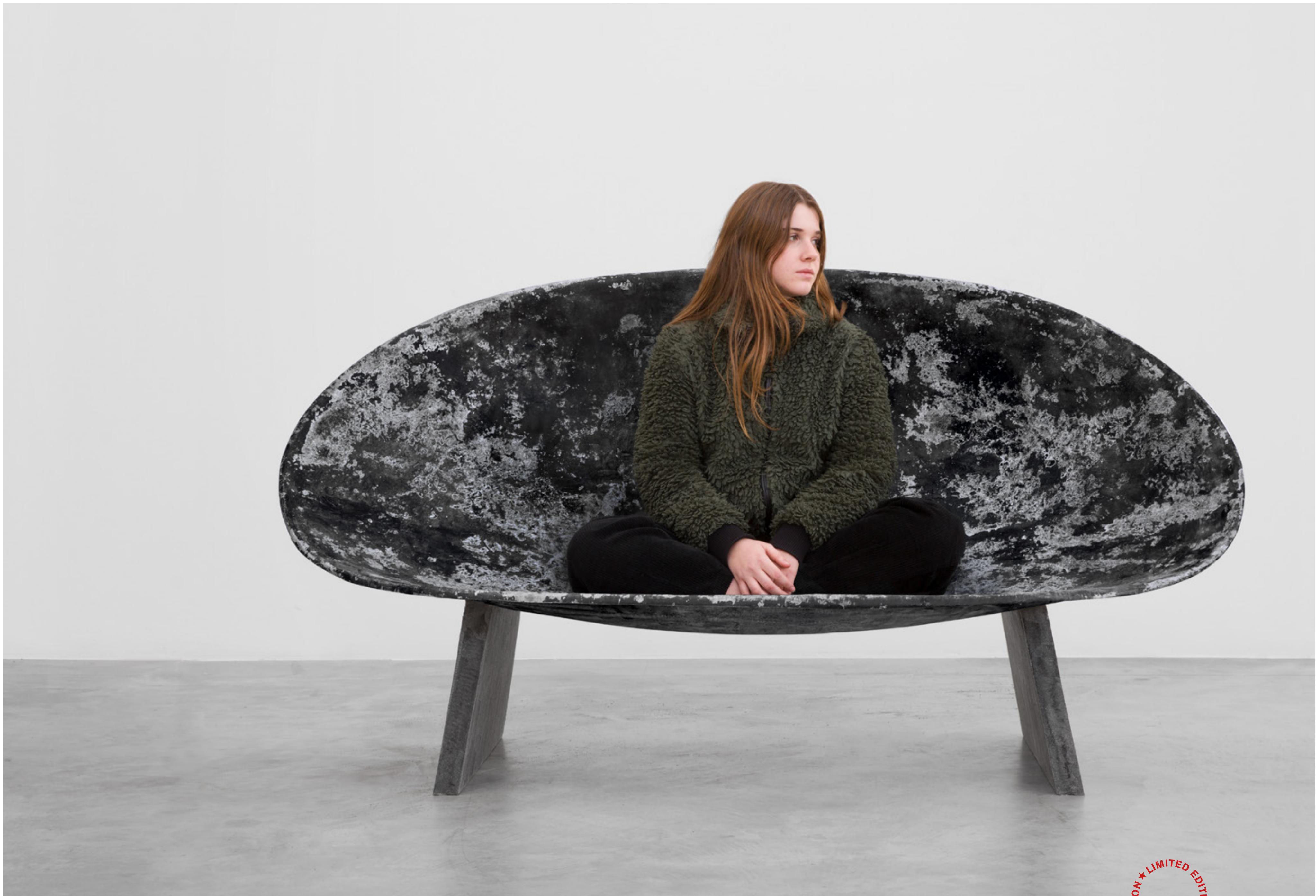
bruma design verter turroni, 2020

seduta in vetroresina sofa in fibreglass cm 190x83xh99