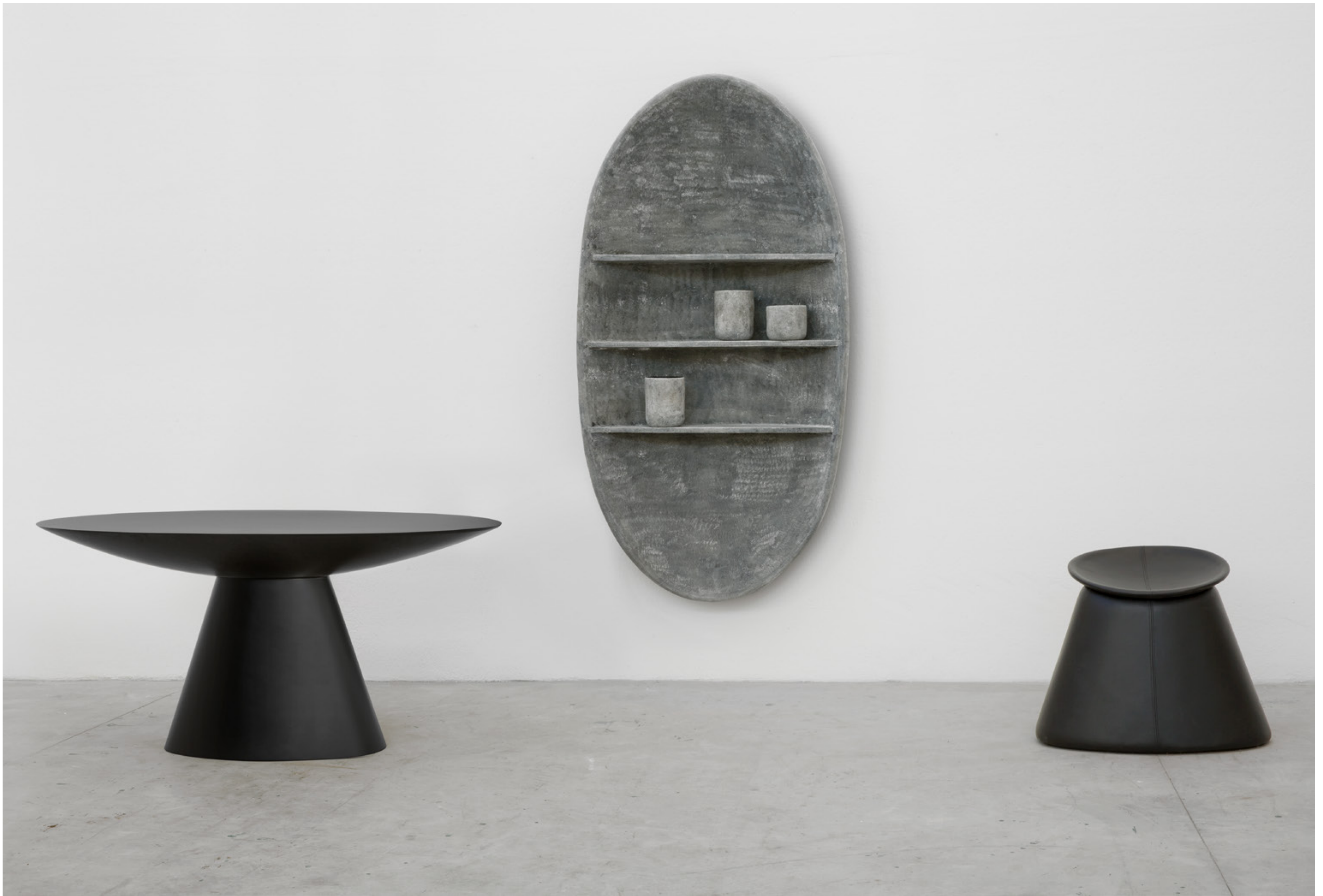
olav design verter turrone, 2020

tavolo ovale in vetroresina oval table in fibreglass cm 179x99xh74