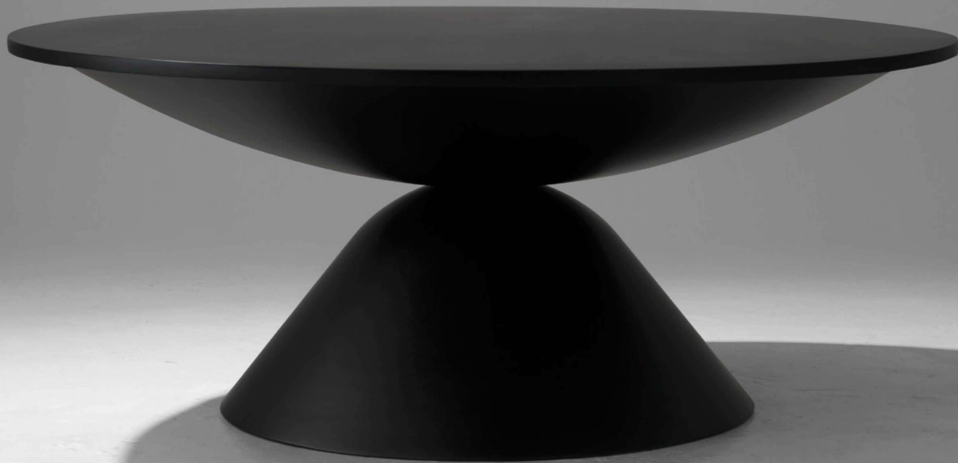
plateau design verter turroni, 2018

tavolo circolare in vetroresina round table in fibreglass cm Ø190xh74