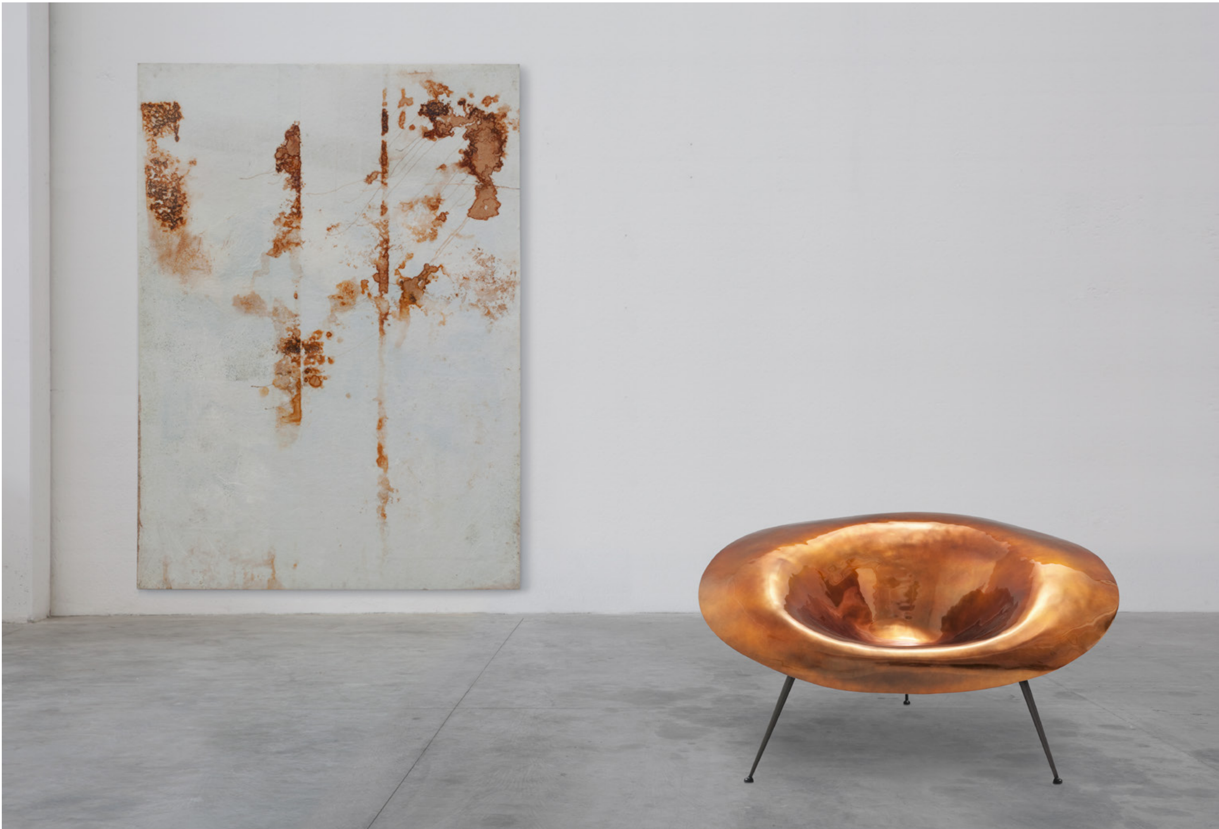
nido design verter turrioni, 2008

seduta in vetroresina, base in metallo armchair in fibreglass, metal base cm 130x97xh66