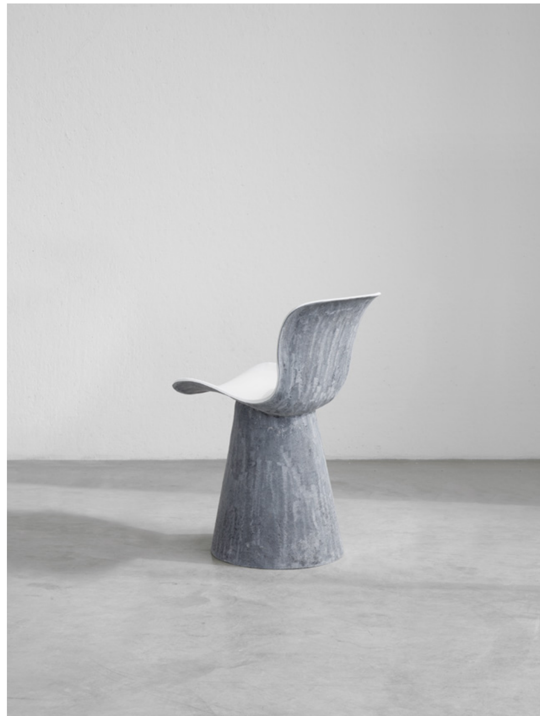
equilibria design verter turroni, 2021

seduta in vetroresina chair in fibreglass cm 45x53xh76